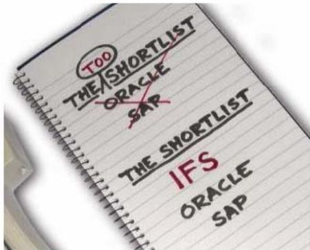
www.ifsworld.com Comentarios: anuncios Google

Madrid, 2 abril de 2008.- Fullstep, compañía especializada en servicios de optimización para la función de compras y aprovisionamiento, ha permitido a sus clientes ahorrar más de 65 millones de euros durante el pasado año. Esta cifra, que se traduce en un ahorro medio en costes del 7,8%, ha sido el resultado de los más de 15.000 procesos de compras que se han gestionado en 2007 a través de la plataforma tecnológica de compras de Fullstep.