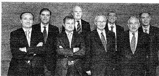
Jurado del premio, tras su última reunión

ga del premio tendrá lugar el próximo lunes, 14 de diciembre, bajo la presidencia de Bruno Delave, embajador de Francia en España. En el transcurso de ese ágape se desvelará el nombre del galardonado, que sucederá al Grupo Planeta, ganador del año pasado gracias en buena medida a la compra de la editorial francesa Editis. / Redacción